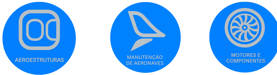
Figura 3 – Os nossos serviços

Os serviços de MRO são a base do nosso negócio. Somos fornecedores de serviços de manutenção e reparação de aeronaves e motores de aeronaves, bem como de manutenção e fabricação de aeroestruturas e componentes de aeronaves. Fornecemos serviços de engenharia e suporte logístico e soluções de suporte de frota, para clientes civis e militares, de todo o mundo.