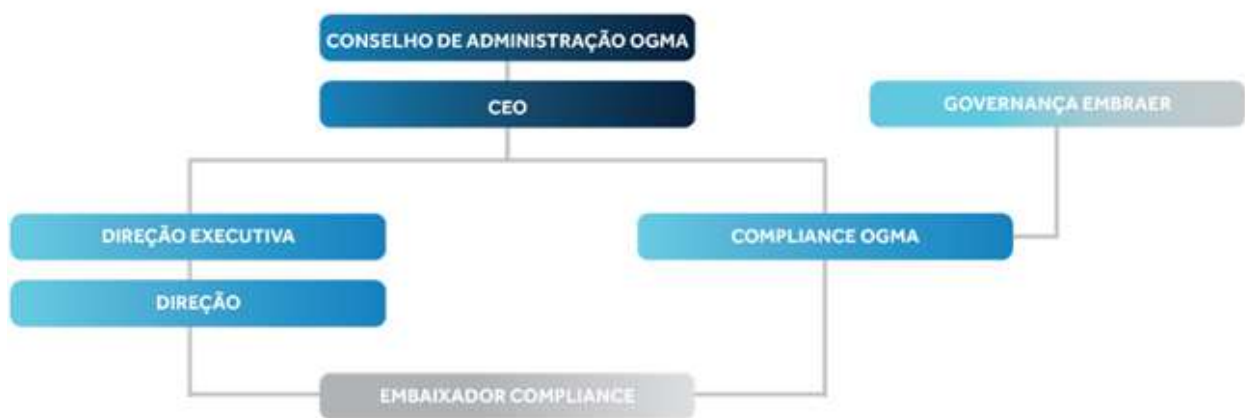
Figura 4 – Modelo de Governo de Compliance

O Responsável pelo Cumprimento Normativo do RGPC , diretor nomeado pelo Administrador Delegado da OGMA, é responsável pela atualização do contexto da organização relativamente a temas de corrupção e infrações conexas, nomeadamente as atividades existentes e os níveis de risco inerente e residual. É também o responsável por fazer a supervisão e coordenação do PPR, em colaboração com a Auditoria Interna. Para esse fim, dispõe de acesso a qualquer informação interna e recursos humanos e técnicos necessários para solicitar informações e o contributo dos diversos departamentos da organização atuando com independência e autonomia nos processos de decisão.